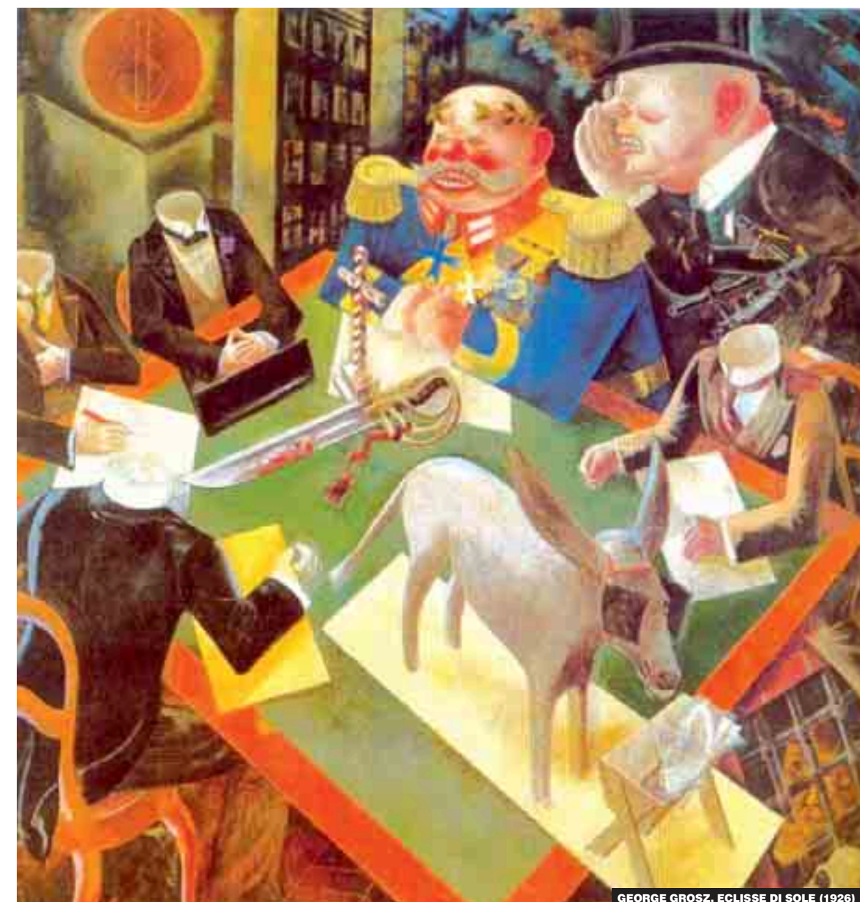
GEORGE GROSZ, ECLIPSE DI SOLE (1926)

tuare dei valori di borsa, sia sul piano dell'equità, perché il patrimonio è distribuito in modo più iniquo rispetto al reddito. Ciò non significa, tuttavia, che alla progressività dell'imposta sul reddito si debba rinunciare, riducendo il numero delle aliquote o addirittura ricorrendo ad una flat tax come talvolta viene proposto addirittura da esponenti del Pd, perché i redditi da lavoro non sono tutti uguali, e sarebbe assurdo privilegiare i top manager pubblici e privati con questo tipo di politica. Il problema, casomai, consiste nel design dell'imposta che, per alcuni aspetti, dovrebbe essere sostitutiva di prelievi esistenti (per esempio, quello sulle rendite finanziarie, ma anche la tassazione ai fini Irfpef per la parte residuale e l'Ici sui beni immobili strumentali) e per altri potrebbe essere aggiuntiva. Recentemente il Fmi ha stimato che l'adeguamento dell'imposizione patrimoniale ai livelli medi di un insieme di Paesi di riferimento porterebbe l'Italia ad un gettito di circa 15 miliardi di euro, ovvero 1 punto di Pil. Sia da un punto di vista qualitativo, sia da un punto di vista quantitativo, quindi, un'imposizione patrimoniale (in parte sostitutiva, in parte integrativa di imposte esistenti) costituisce un'alternativa di sicuro interesse.