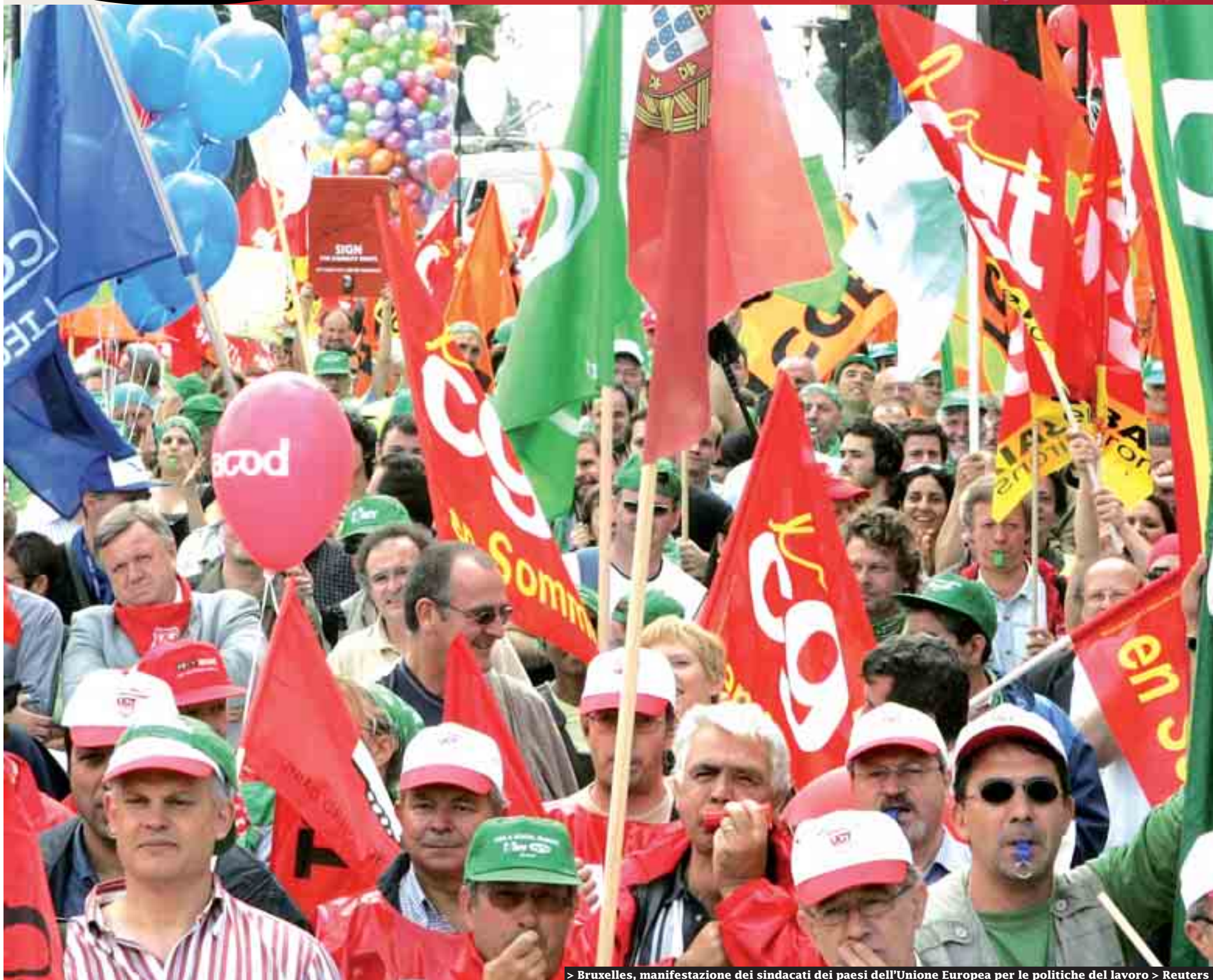
> Bruxelles, manifestazione dei sindacati dei paesi dell'Unione Europea per le politiche del lavoro